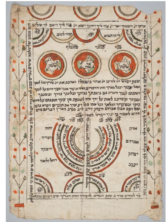
Amuleto, protezione per un infante. Grecia, 1851. Manoscritto cartaceo Columbia University Libraries, MS X893 K514.4 Rare Book and Manuscript Library

UNIVERSITÀ DEGLI STUDI DI FERRARA - EX LABORE FRUCTUS -