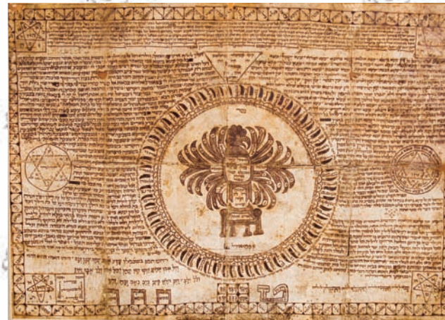
Amuleto, protezione di una partoriente e un infante contro Lilith, Inchiostro su pergamena. India, XVIII secolo, Magnes Collection 2007.0.65